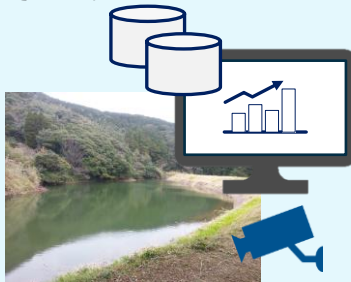
監視カメラを使えば画像確認も可能 ※監視カメラはオプションです

監視端末から「現在水位情報」「水位の変化量」「バッテリー電圧」などが数値やグラフで確認できます。