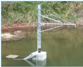
ため池に設置した水位センサー

水位センサーをため池の所定場所に設置。水位のデータは無線通信を経由して、一定間隔でクラウドサーバへ送られます。